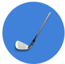
削られていないアイテム