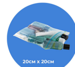
20cm x 20cm