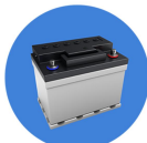
腐食性バッテリー